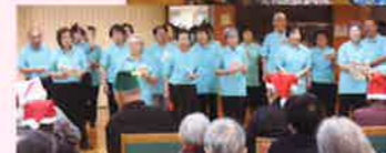
ボランティア同好会 「歌って踊って長生きし隊」